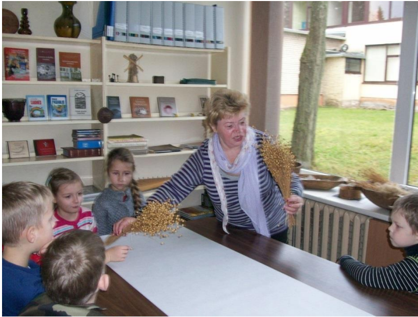
Edukacinė programa “Lino kelias”