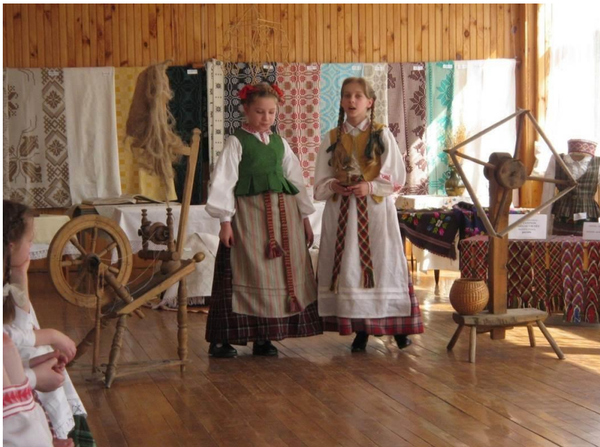
Paroda “Močiutės skrynią pravėrus”

Foto galerija – Edukacinės programos”Lino kelias”, ”Lietuva – garbingos istorijos kraštas”, ”Auskim, sesutės, drobeles”